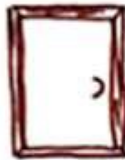
В эту дверь