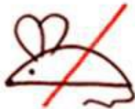
не для мыши.