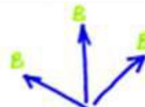
во все стороны летят.