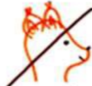
не для белки,