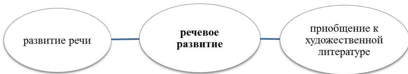
Таблица 3. Методическое обеспечение образовательной области «Речевое развитие»