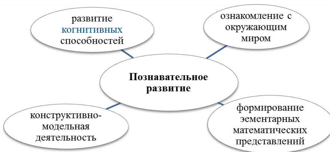
Таблица 2. Методическое обеспечение образовательной области «Познавательное развитие»

Познавательные процессы окружающей действительности дошкольников с ЗПР обеспечиваются процессами ощущения, восприятия, мышления, внимания, памяти.