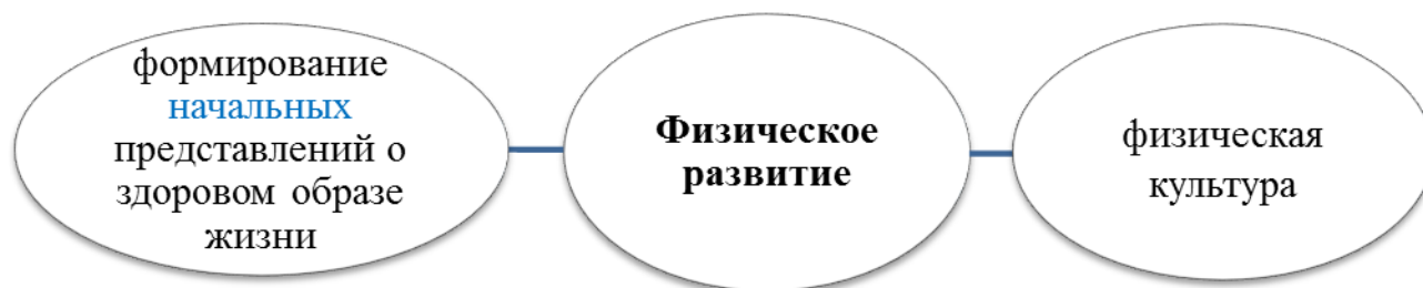
Таблица 5. Методическое обеспечение образовательной области «Физическое развитие»