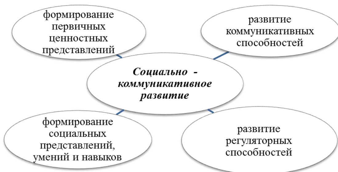
Таблица 1. Методическое обеспечение образовательной области «Социально-коммуникативное развитие»