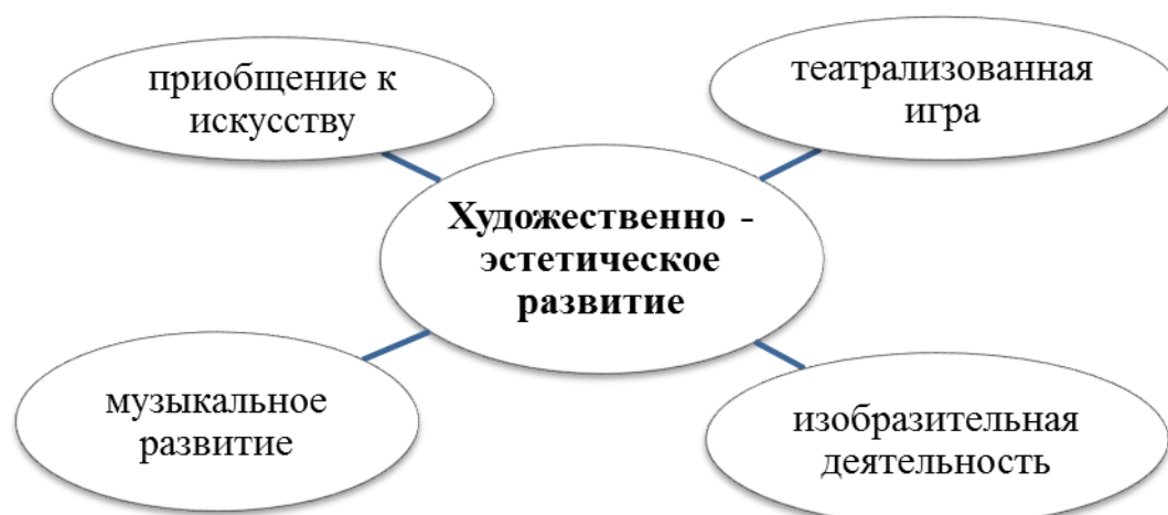
Таблица 4. Методическое обеспечение образовательной области «Художественно-эстетическое развитие»